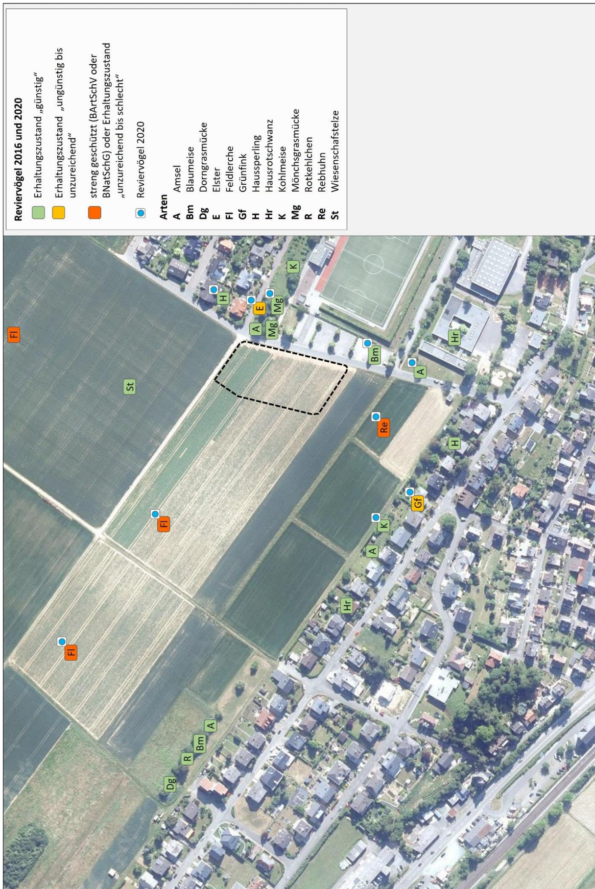
Abb. 3: Reviervogelarten im Untersuchungsraum (Bildquelle: Hessisches Ministerium für Umwelt, Klimaschutz, Landwirtschaft und Verbraucherschutz, aus natureg.hessen.de, 07/2020).