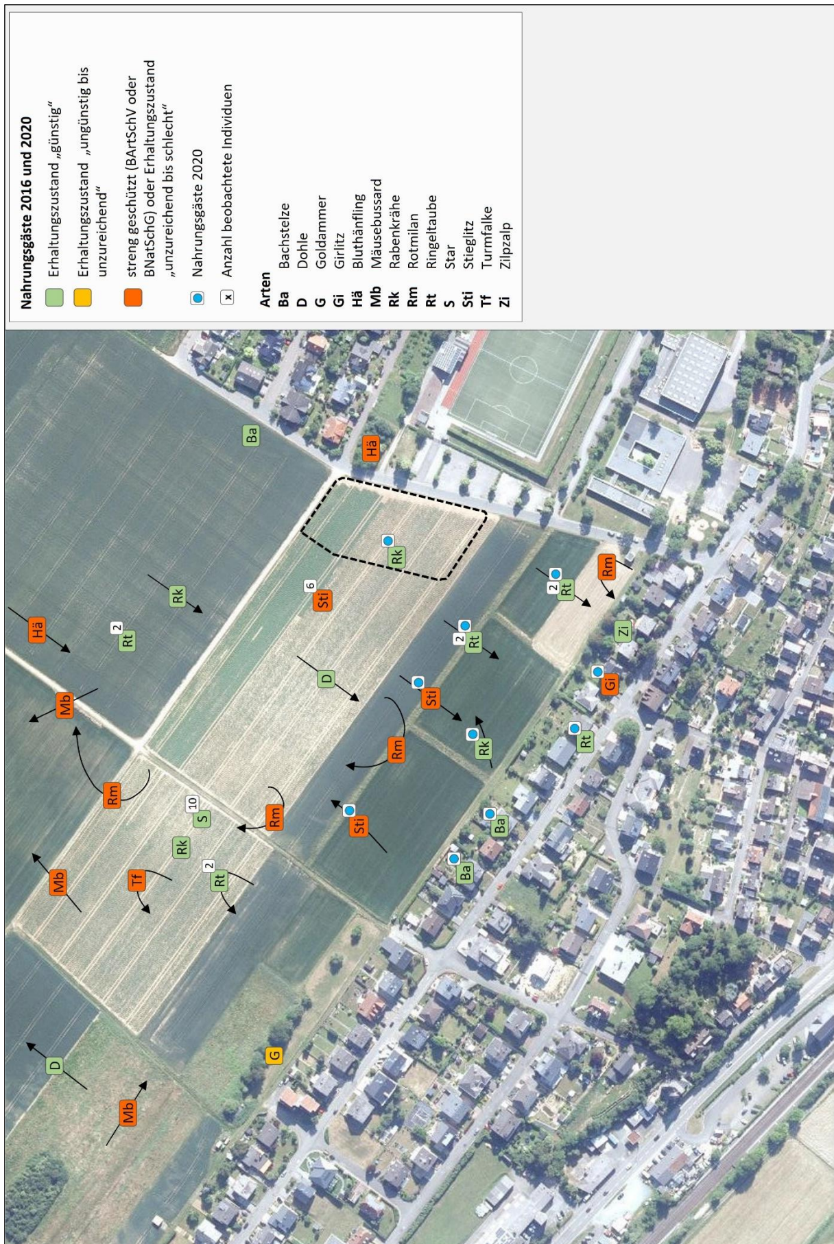
Abb. 4: Nahrungsgäste im Untersuchungsraum (Bildquelle: Hessisches Ministerium für Umwelt, Klimaschutz, Landwirtschaft und Verbraucherschutz, aus natureg.hessen.de, 07/2020).