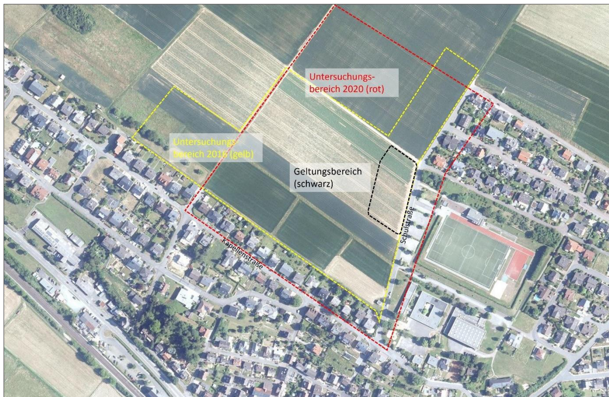
Abb. 1: Abgrenzung des Geltungsbereichs des Bebauungsplans „Neubaugelbiet Mergel“, 1. Änderung; Gemeinde Brechen, Ortsteil Oberbrechen.

Die Erhebungen stammen aus dem Jahr 2016 (gelb markierter Bereich) sowie aus dem Jahr 2020 (rot markierter Bereich) (Abb. 1).