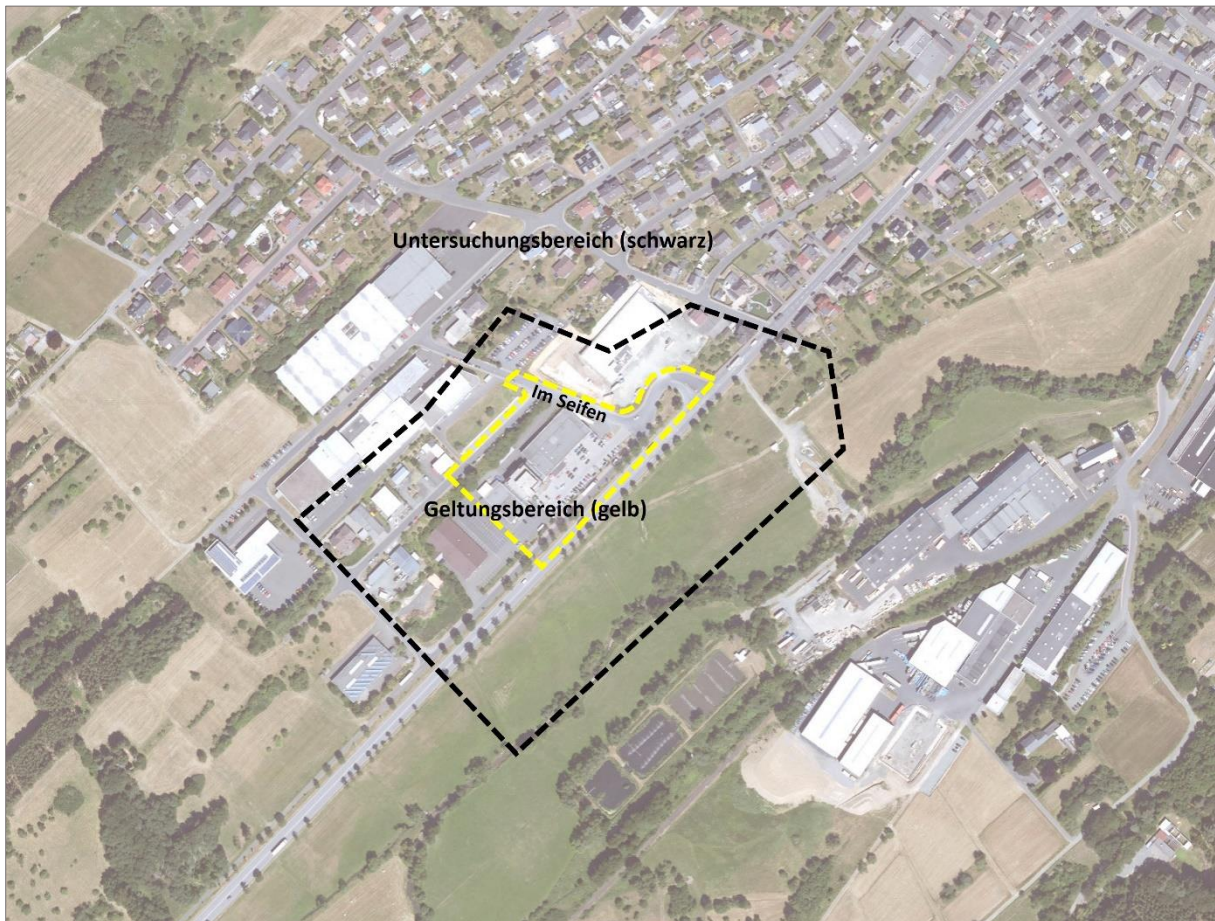
Abb. 1: Abgrenzung des Geltungsbereichs (gelb) sowie des Untersuchungsbereichs (schwarz) zum Bebauungsplan „Im Seifen“, 1. Änderung; Gemeinde Eschenburg, Ortsteil Wissenbach.

Das vorliegende Gutachten verfolgt die in diesem Zusammenhang geforderte Überprüfung, ob durch die geplante Nutzung artenschutzrechtlich besonders zu prüfende Arten betroffen sind. Gegebenenfalls ist sicherzustellen, dass durch geeignete Maßnahmen keine Verbotstatbestände gemäß § 44 BNatSchG eintreten.