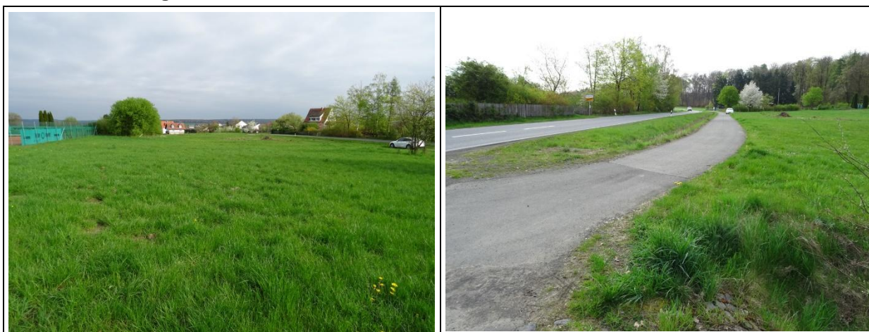
Eigene Aufnahmen (04/2024)

Der Bereich des Plangebietes ist topografisch weitgehend eben und bewegt sich auf einem Höhenniveau zwischen rd. 308 m über Normalhöhennull (ü.NHN) im Norden und rd. 310 m ü.NHN im Süden.