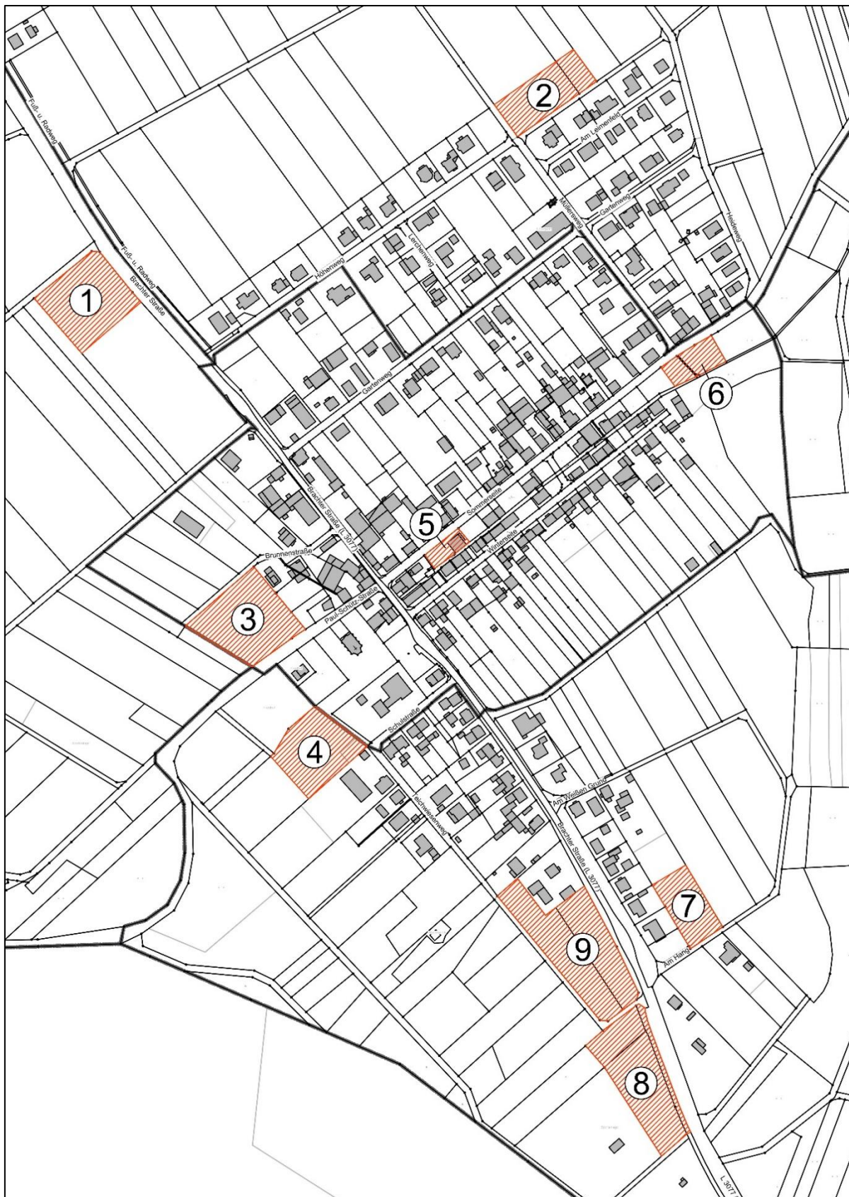
Eigene Darstellung genordet, ohne Maßstab