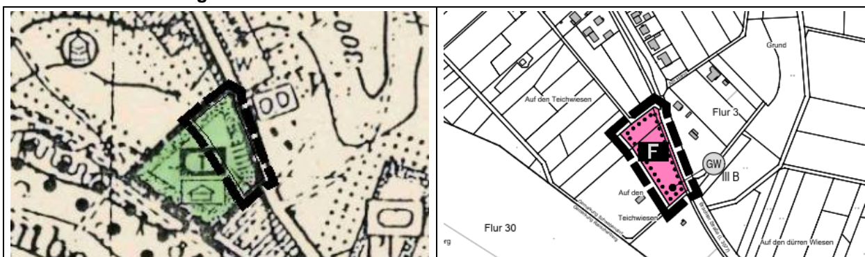
Ausschnitte genordet, ohne Maßstab

Das Planziel der 40. Änderung des Flächennutzungsplanes der Stadt Rauschenberg ist die Darstellung von Flächen für den Gemeinbedarf mit der Zweckbestimmung „Feuerwehr“ zulasten der bisherigen Darstellungen. Der räumliche Geltungsbereich der 40. Änderung des Flächennutzungsplanes umfasst dabei nicht den vollständigen räumlichen Geltungsbereich des Bebauungsplanes Nr. 5 Feuerwehrstandort „Westlich der Brachter Straße“, sondern lediglich den Bereich des eigentlichen Baugrundstückes sowie den Bereich des östlich an das Baugrundstück angrenzenden asphaltierten Weges. Mit der teilräumlichen 40. Änderung des Flächennutzungsplanes werden auf Ebene der vorbereitenden Bauleitplanung die planungsrechtlichen Voraussetzungen für die städtebauliche Entwicklung und Erschließung des Plangebietes im Zuge der Aufstellung des Bebauungsplanes Nr. 5 Feuerwehrstandort „Westlich der Brachter Straße“ geschaffen.