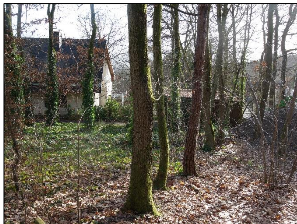
Blick in den geplanten Zufahrtsbereich