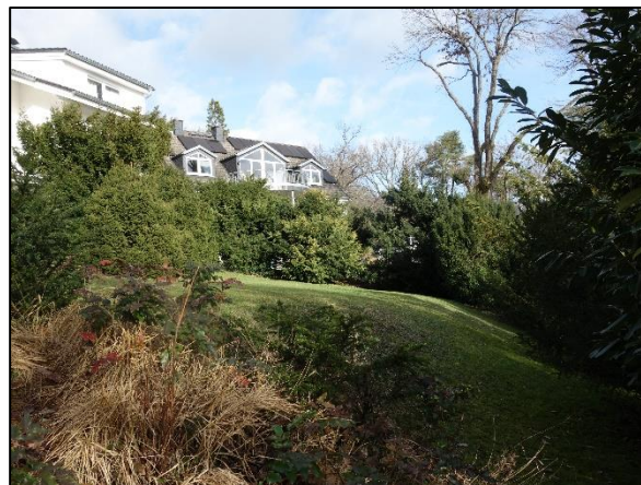
Blick in den zentralen Garten