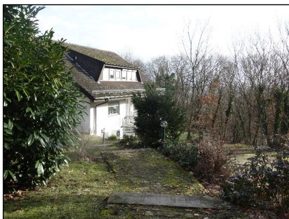
Blick in Richtung des südlichsten Gebäudes